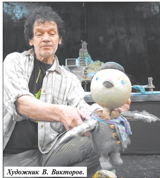
Художник В. Викторов.