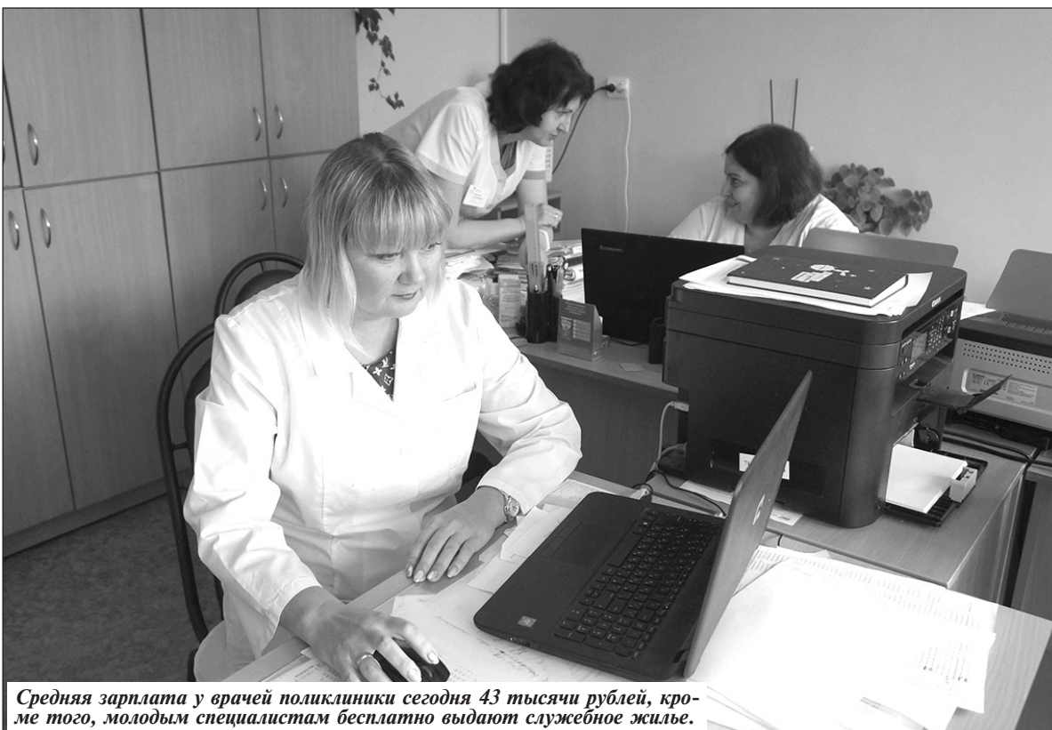
Средняя зарплата у врачей поликлиники сегодня 43 тысячи рублей, кроме того, молодым специалистам бесплатно выдают служебное жилье.

В сельской местности тоже созданы условия для привлечения врачей. Кроме жилья им выделяют один миллион рублей по программе «Земский доктор».