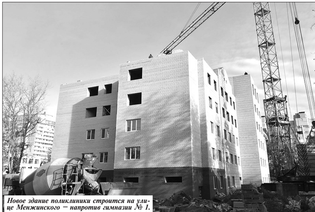
Новое здание поликлиники строится на улице Менжинского — напротив гимназии № 1.