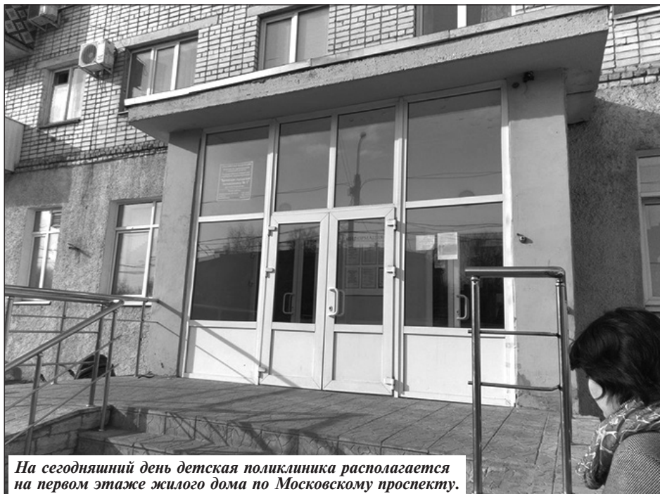
На сегодняшний день детская поликлиника располагается на первом этаже жилого дома по Московскому проспекту.